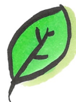
Natur und Umwelt